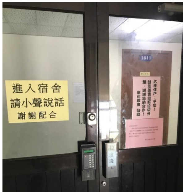
4. 刷門禁進入住宿區 (住宿區走廊牆上貼有 wifi 說明及密碼)